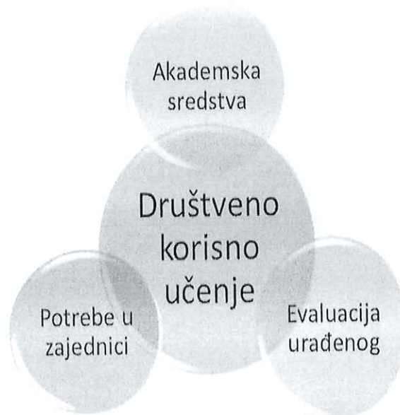
Slika 1. Ideja društveno korisnog učenja je da poveže znanja stečena na nastavi sa potrebama u zajednici.

Za učenike društveno korisno učenje predstavlja skup znanja i iskustava koje stiču kroz aktivnosti koje sami osmisle, odaberu i realizuju. To trebaju biti aktivnosti u kojima uživaju, a koje su izazovne i zanimljive, te čijom realizacijom učenici razvijaju nova znanja i vještine, koje kroz tradicionalnu nastavu uglavnom nisu u mogućnosti razviti.